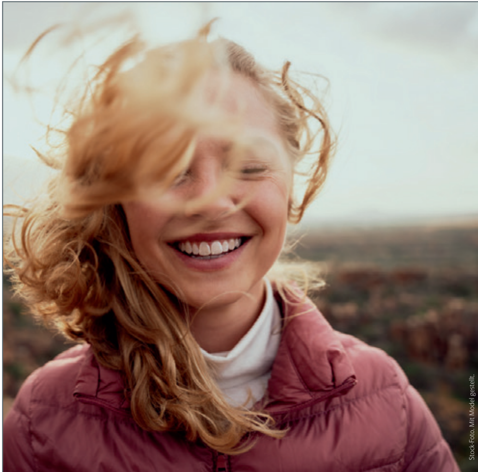
Stock-Foto. Mit Model gestellt.